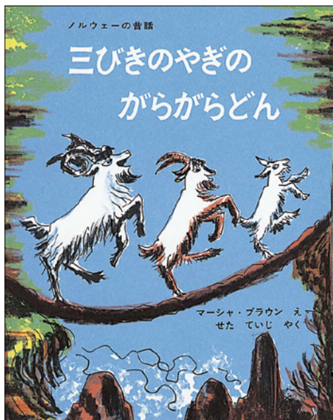
三びきのやぎの がらがらどん ノルウェーの昔話