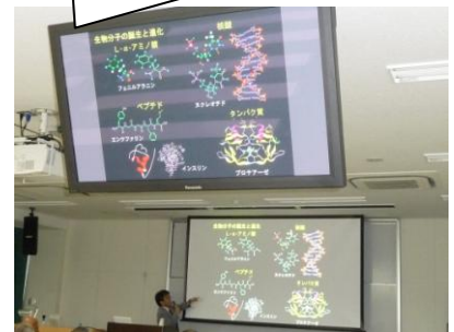
(長浜バイオ大学での様子)

新しい知識が増えた事、友人(学びの)が増えたことがよかったです。長浜バイオ大学はすごい。