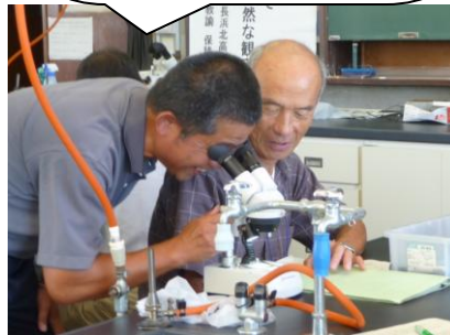
(高等学校での実験の様子)

市内の高校で、いろんな機材に久しぶりに触れられよかったです。お土産があったのもいい。