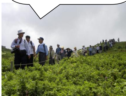
(現地研修での様子)

伊吹山のお花畑の保全活動の現状を学んだ。微力でも自然を守ることを実践していきたい。