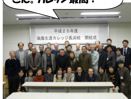
(長浜バイオ大学での様子)

初めて入った長浜バイオ大学。内容も盛りだくさん。多くの学びの友ができた。カレッジ最高!