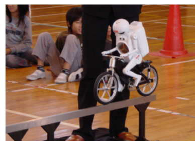
自転車に乗れるロボットの実演