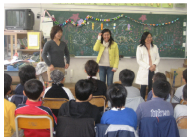
地元の大学・留学生との交流