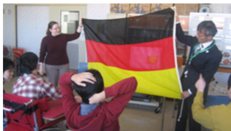
滋賀県国際課による「世界の国々・世界の料理」