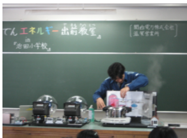
エネルギーについて学ぶ出前教室