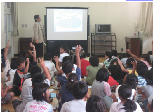
彦根地方気象台による「天気の変化～台風～」