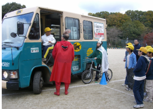
宅配業者による「交通安全教室」