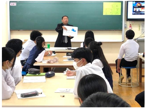
アパレル関係販売者