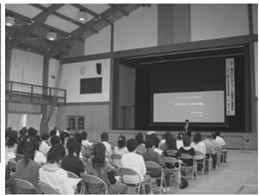
↑ 辻 延浩氏による教育講演会 現：滋賀大学教育学部准教授 健やかな体をつくる睡眠の重要性