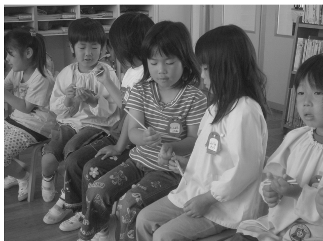
【おはしを持ってみよう】