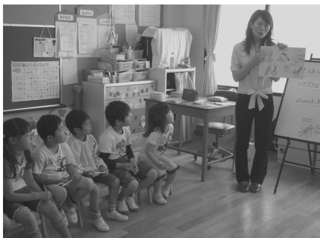
【おはしの持ち方の指導】