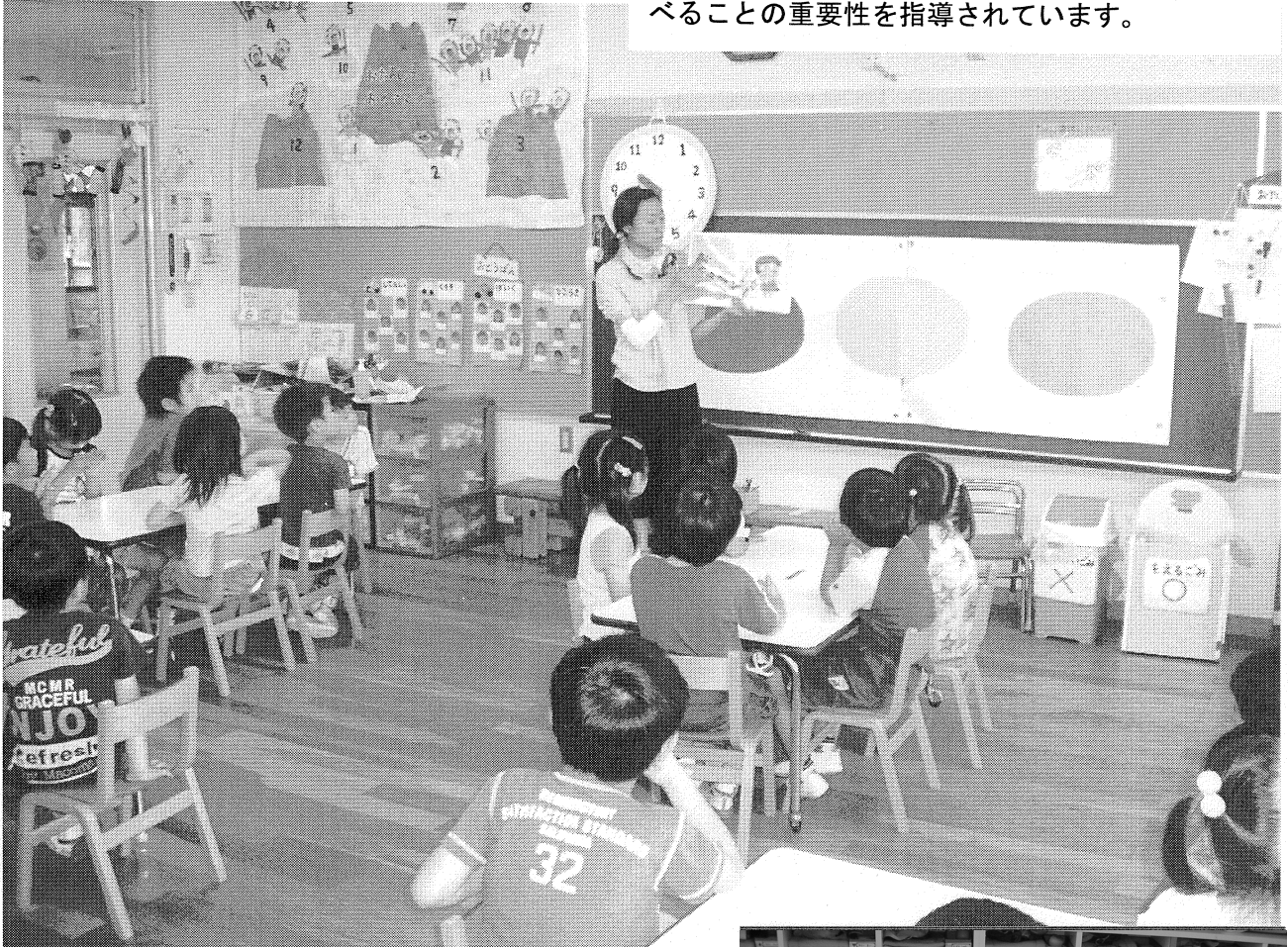
【元気を作る食育の絵本を読んで↑】

社会福祉法人彦根福社会立亀山保育園では、毎日の給食や朝食などを、赤・緑・黄の三色に分け、食材に興味関心が持てるように意識づけをし、食べることの重要性を指導されています。