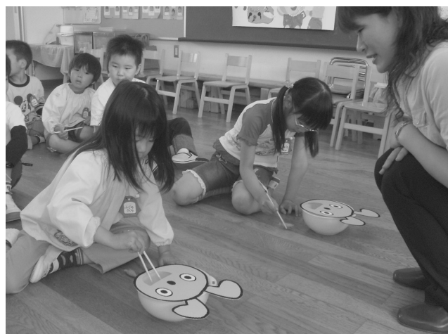
【おはしを使ったゲーム】