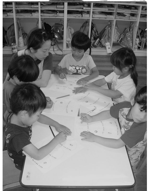
【自分の好きな食べ物の絵を色分けして描いてみよう→】