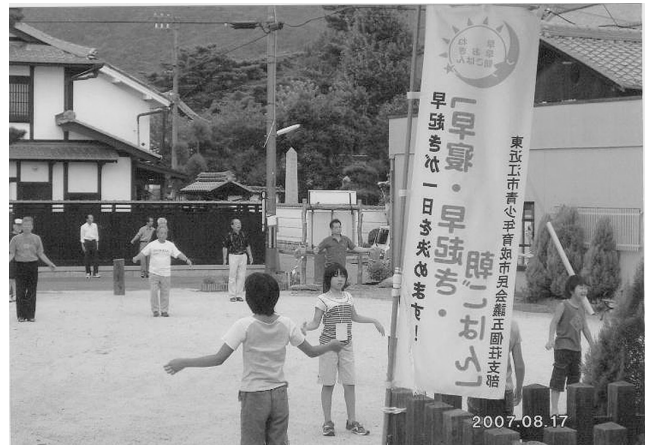
【金堂町でのラジオ体操】