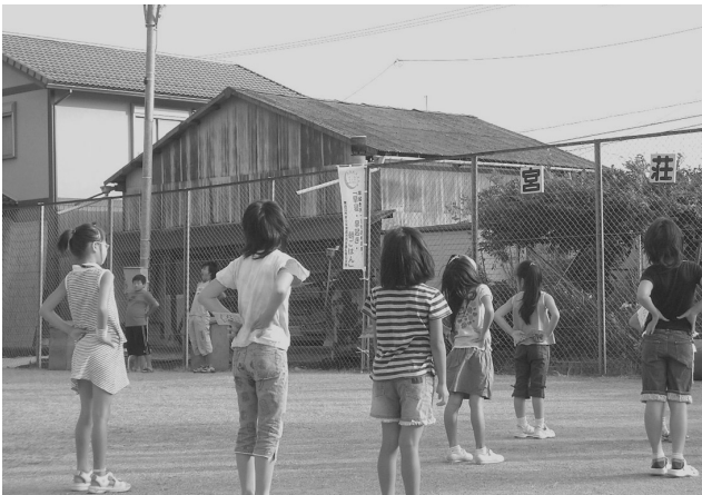
【宮荘町でのラジオ体操】