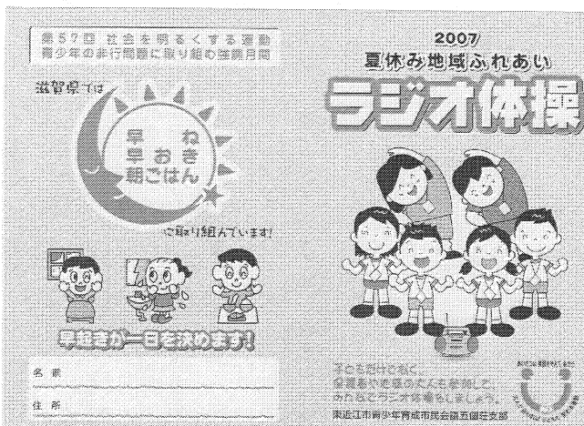
【ラジオ体操カード 表】

なお、平成20年度は、東近江市青少年育成市民会議の家庭部会で、全市対象に各地区の特色を生かして「早寝・早起き・朝ごはん」運動に取り組まれることになっています。