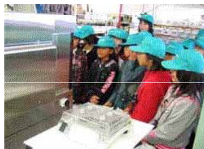
株式会社イシダ（体験学習）