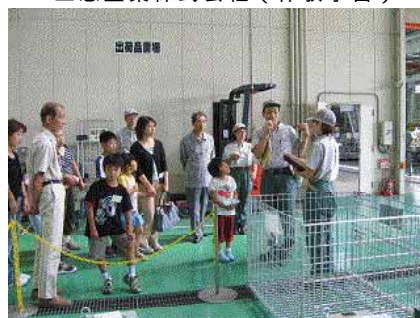
兵神装備株式会社滋賀工場（見学会）