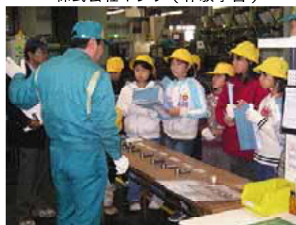
三恵工業株式会社（体験学習）