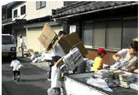
セキシン電子株式会社 (地域の子どもの会の廃品回収に協力)