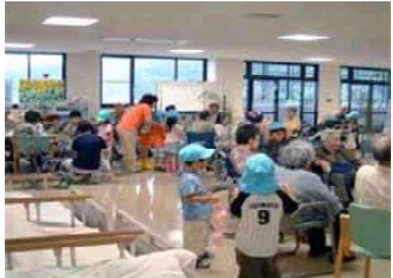
介護老人保健施設スキナヴィラ水口 (子どもたちとお年寄りの交流に協力)