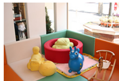
キッズスペースの設置