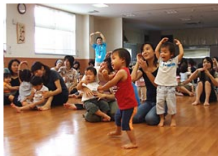
親子ふれあい教室