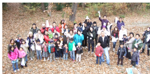
親子ふれあいイベントの様子