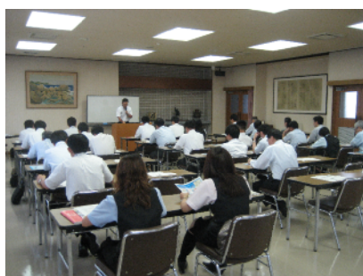
家庭教育学習講座の様子