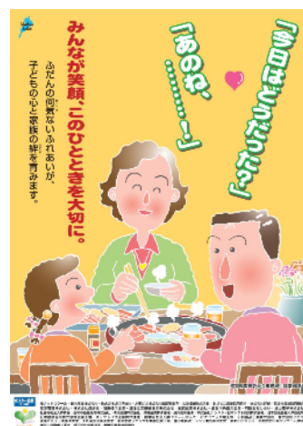
協定企業の協賛をいただいた啓発ポスター