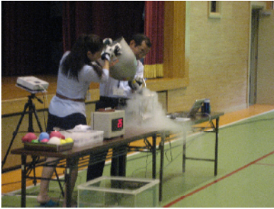
学校へのお出前授業