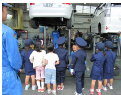
社会見学の受け入れ