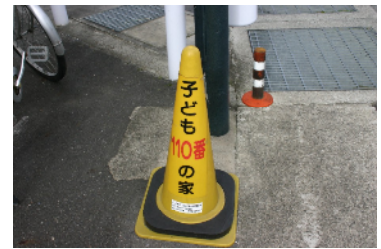
子ども110番の家コーン設置