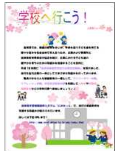
【事業所内での掲示チラシ】