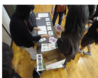
【学校への出前講座の様子】