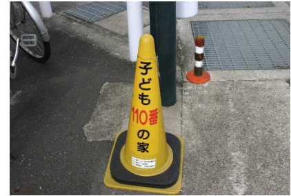
【子ども110番のコーン設置】