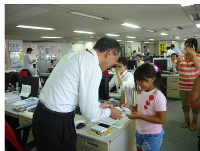
【ファミリーデーの様子】