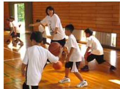
【スポーツ大会への協力・協賛】