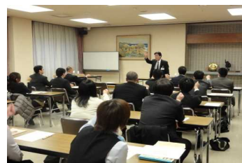
【企業内家庭教育学習講座の様子】