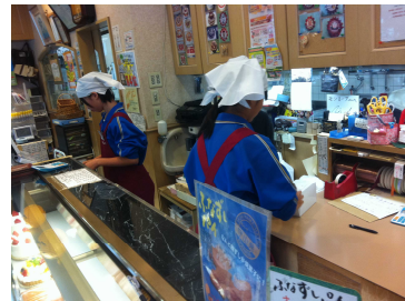
【職場体験学習の様子】