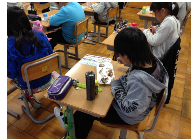
〈「いちば食育隊」による出前授業〉