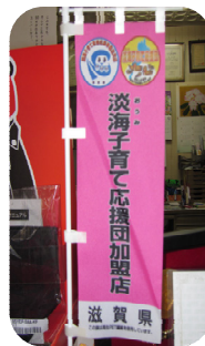
淡海子育て応援団加盟店

地域の自転車店として、淡海子育て応援団に加盟し、子育てをされている御家庭に特典があるなど、お客様に満足いただけるお店を目指している。