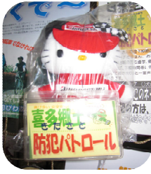
喜多郷土(きたさと) 防犯パトロール