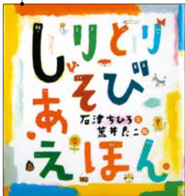
ししづ 石津 ちひろ 文 あらい ひょうじ 荒井 良二 絵 のら書店