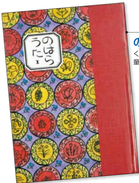
のはらうた I~IV くどう なおこと のはら みんな 童話屋

はる、なつ、あき、ふゆ、 のはらむらをさんぼしていると、 のはらむらのみんながしゃべります。 うれしいことやかなしいこと・・・ いろんなおもいがうたになりました。 きいてみてね。