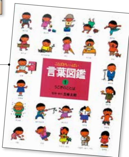
ことばが いっぱい ことば すかん 言葉図鑑1~10 こみ たろう 五味 太郎 監修・制作 偕成社