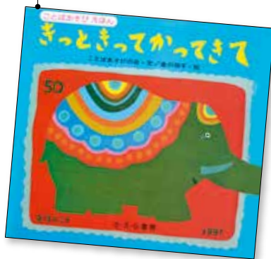
きつときてかてきて (ことばあそび えほん) ことばあそびの会 文 かながわ ていこ 金川 禎子 絵 さ・え・ら書房