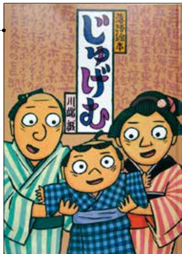
じゅげむ あぐさ えほん (落語絵本) かわばた まこと 川端 誠 クレヨンハウス