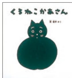
くろねこかあさん