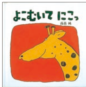
よこむいて にこっ