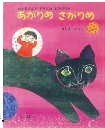
あがりめ さがりめ