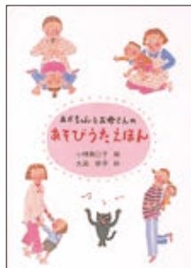
あかちゃんとお母さんのあそびうたえほん

この小さな絵本には、はっきりした色彩のシンプルな絵が描かれています。そこに描かれたものや生き物は、赤ちゃんが知っているものです。その音や鳴き声は、聞き覚えのあるものです。興味を持った赤ちゃんは、自動車や犬を指差し、「ぶーぶー」「わんわん」と声を上げて喜びだすことうけあいです。