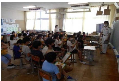
災害派遣活動DVD上映