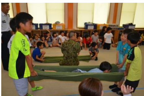
応急担架作成要領及び搬送要領