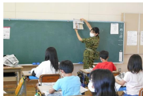
生活支援活動の紹介