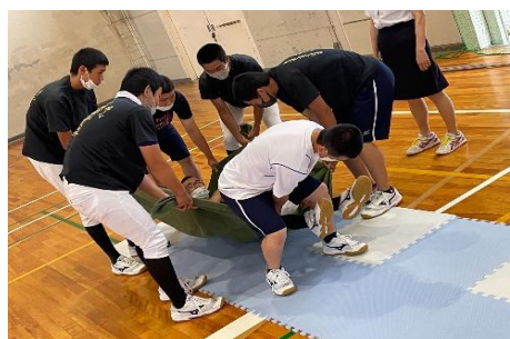
応急担架搬送要領