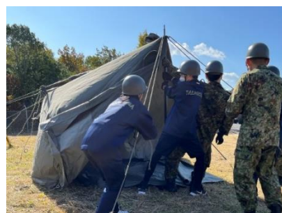
テントの設営体験