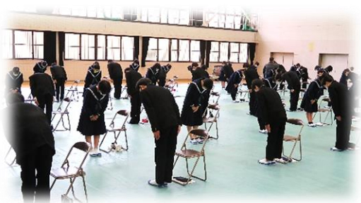
マナー講座(平成30年度)