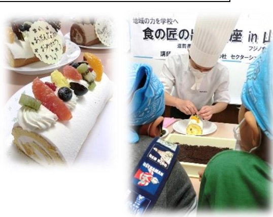
パティシエとケーキ作り(令和元年度)