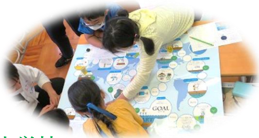
水の学習(令和3年度)