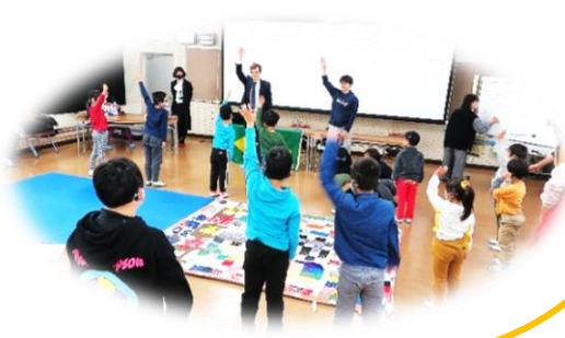
国際理解教育(令和2年度)