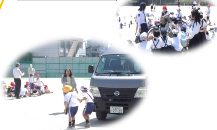
交通安全教室(令和4年度)