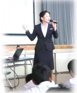
レジリエンス[立ち直る力]アップ講義(平成29年度)