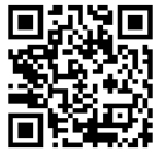
におねっと二次元コード