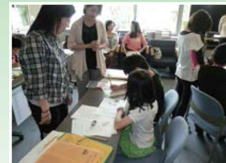
国際理解学習 【国際理解／小学校】