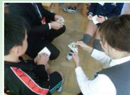
お金のはなし 【金融・経済／小学校】