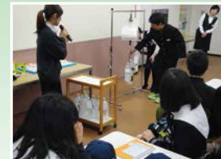
ものづくりの現場に学ぶ 【自然・環境／中学校】