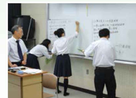
将来きっと役立つ！働くときの基礎知識 【その他／高等学校】