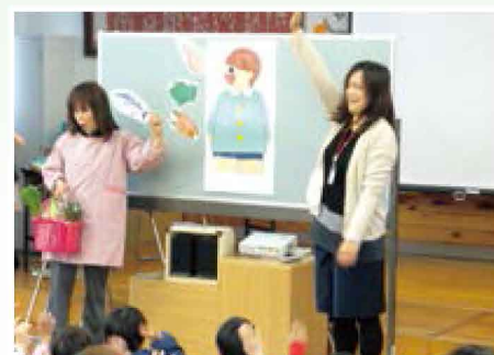
おなか元気！みんな元気！ 【食育／幼稚園】