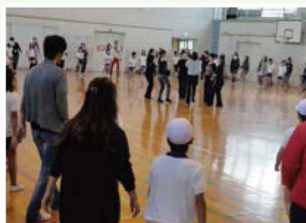
コーディネーション運動・ダンスを楽しもう 【スポーツ・運動・自然体験／小学校】