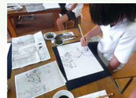
文化芸術体験（鳥獣人物戯画で学ぶ） 【文化・伝統・芸術／小学校】