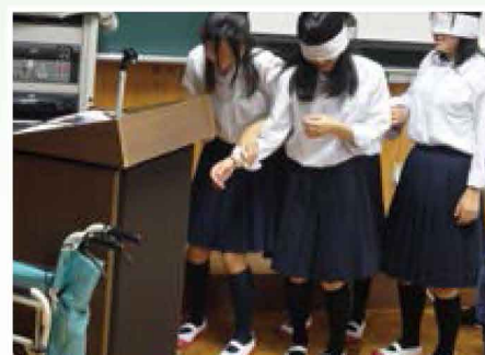
やさしい介護技術体験 【福祉・ボランティア／中学校】