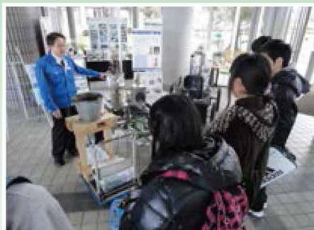
3Dプリンターで何ができるの？ 【科学（理数）／特別支援学校】