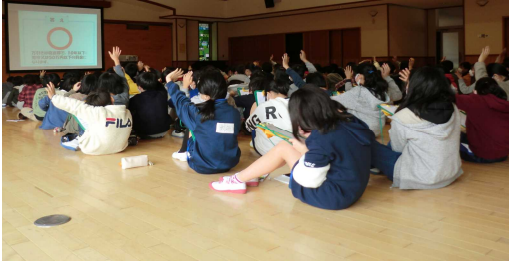
クイズに答える児童