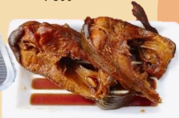
大アマゴ煮つけ(2切れ) ¥500