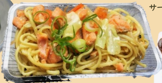
サーモン塩焼きそば ¥300