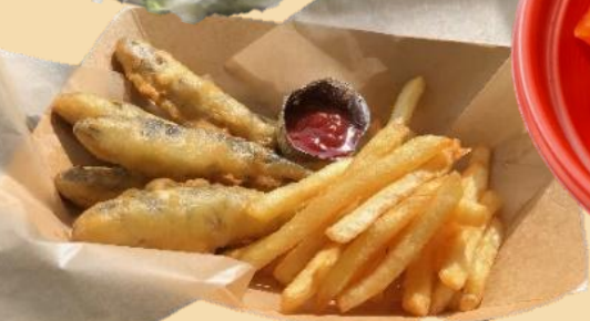
びわますの カリッふわスティックと フライドポテト ¥500