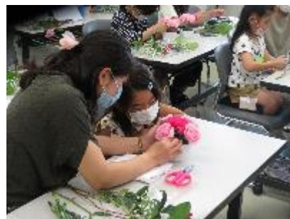
【 活動の様子 】