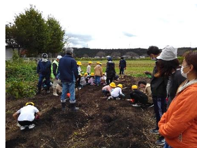
【 芋掘り体験 】