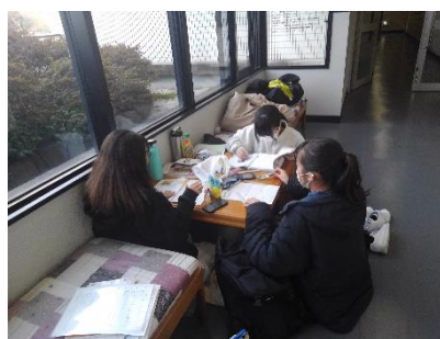
【 活動の様子 】

苦手意識を持っていた子ども徐々に英語に親しみを覚えるようになった。日常会話の中で活用できるようになるには、自然に少しずつ行っていくことが大切なので時間をかけて取り組む必要があると思う。