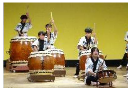
【 発表会の様子 】