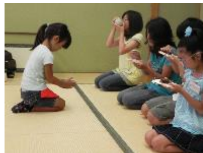
【 体験会の様子 】