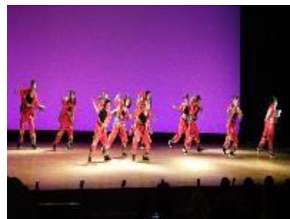
【 発表会の様子 】