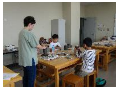
【 作陶の様子 】