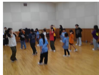
【 教室の様子 】

コロナ禍の制限がなくなり従来の活動ができるようになった。今後は発表の機会を増やしたり内容の充実を図ったりして、参加人数が増えるようにしたい。