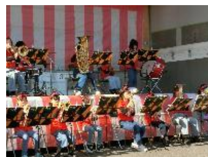
【 発表会の様子 】