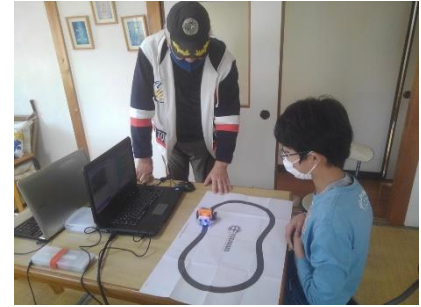
【 教室の様子 】