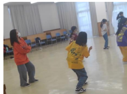
【 教室の様子 】

コロナ禍の制限がなくなり従来の活動ができるようになった。今後は発表の機会を増やしたり内容の充実を図ったりして、参加人数が増えるようにしたい。