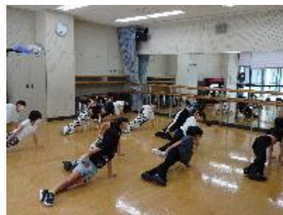
【 練習の様子 】