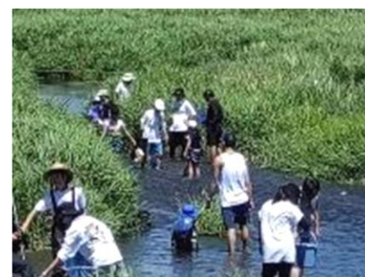
【 活動の様子 】