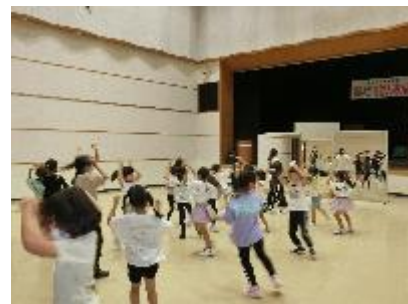
【 練習の様子 】