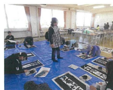
【 毛筆練習 】

・小学校2年生から6年生までの小学生を対象として、同じ教材をもとに継続した取り組みができていますので、6年生まで継続してくれる子どもが多い。