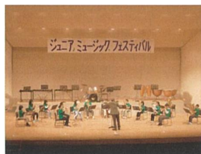
【ジュニア・ミュージック・フェスティバル出演】