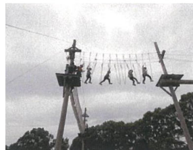
【 アドベンチャー体験 】