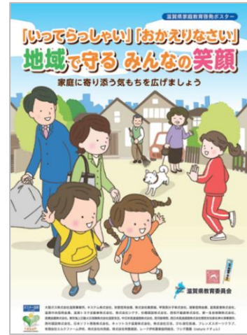
令和3年度 テーマ:「地域の大人から子どもや保護者への言葉がけ～子どもを育むために～」