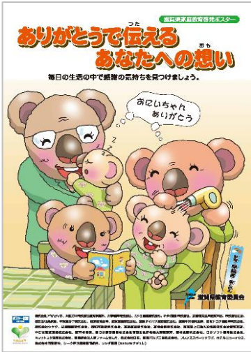
令和元年度 テーマ:「子どもを育む言葉がけ」