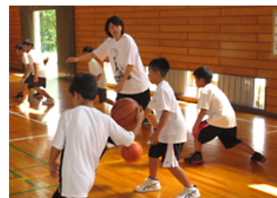
【スポーツ大会への協力・協賛】