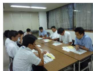
【家庭教育学習講座の様子】