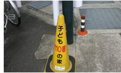
【子ども110番のコーン設置】