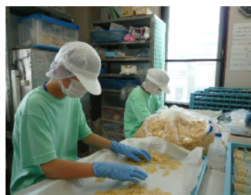
【職場体験学習の様子】