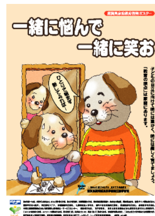
【家庭教育啓発ポスター】