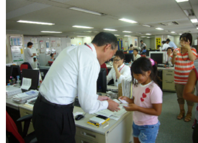
【ファミリーデーの様子】