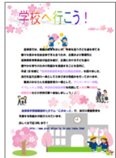
【事業所内での掲示チラシ】