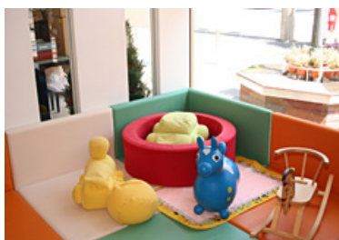
【キッズスペースの設置】

淡海子育て応援カード(携帯電話の画面)を提示することで、子育て中のご家庭に様々なサービスを提供していただいています。