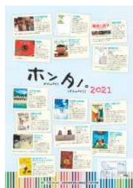
▲中学生向け 読書啓発ポスター