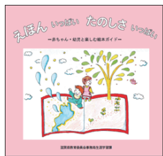
▲赤ちゃん・幼児向け 読書啓発冊子