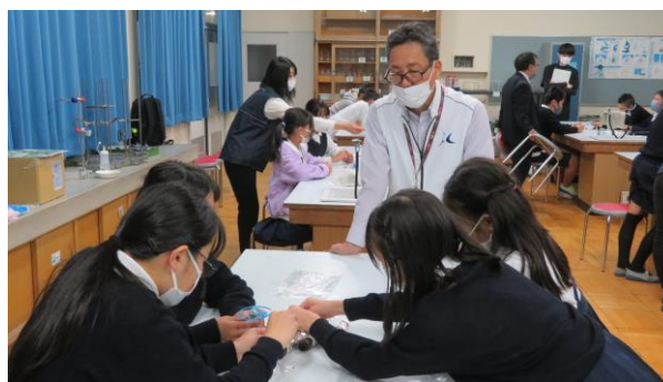
理科教育（子ども電気教室）