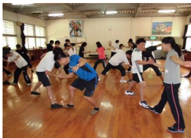
(フィンガーフェンシング)

1日目は、「学ぼう」をテーマに緊張をほぐすため、主にアイスブレイクを中心に研修を行いました。身体や気持ちをほぐすためのアクティビティから、心の壁を下げ、安心を育むためのアクティビティへと段階を追って、活動を進めていきました。