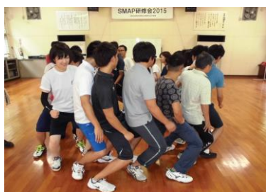
(ヒューマンチアリーダー)