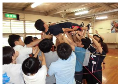
(スパイダースウェブ)

活動後は、学びを深める振り返りを行い、やってみて感じたことを発表することで、学びを共有しました。